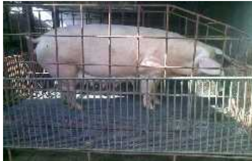
Gambar: Kandang individual

Kandang individual merupakan kandang yang disekat-sekat sehingga tiap sekat akan berisi satu ekor ternak babi.