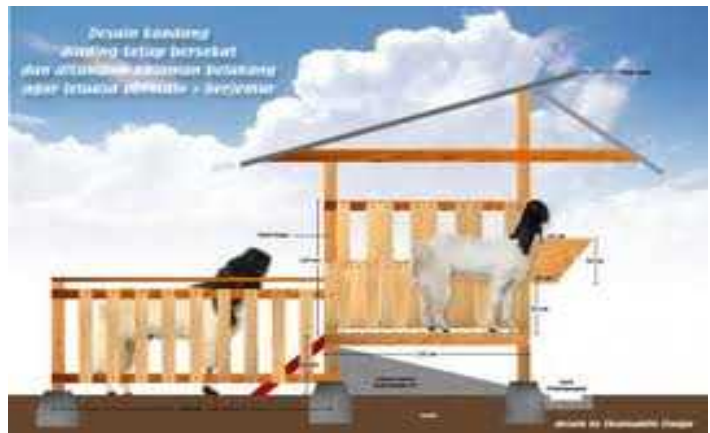
Gambar: Kandang individual

Kandang individual merupakan kandang yang disekat-sekat sehingga tiap sekat akan berisi satu ekor ternak kambing atau domba. Luasan setiap sekat kandang berukuran sekitar 0,75 m x 1,4 m atau 0,7 m x 1,5 m.