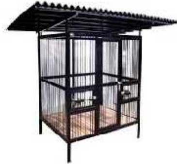
Gambar Kandang individu yang beratap dari logam

1.5.1.2.2.2. Kandang dari logam yang beratap.