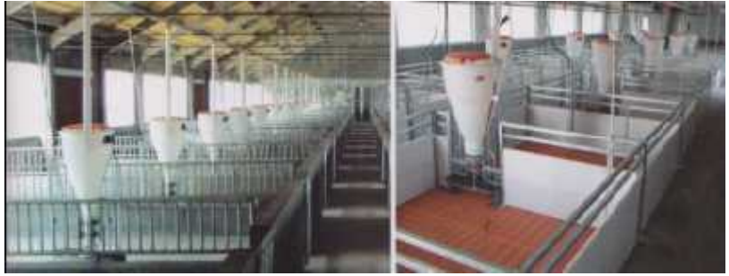
Gambar: Kandang Koloni/kelompok

1.4.1.4. Dilengkapi dengan tempat/bak atau peralatan memberi pakan dan minum yang terbuat dari bahan yang kuat, mudah dibersihkan dan disucihamakan. Cara memberi pakan atau minum dapat secara otomatis (berupa nozzle ) maupun manual. Tempat/bak atau peralatan memberi pakan dalam kandang harus dibuat sedemikian rupa sehingga pakan/minuman yang diberikan tidak tercecer. Jumlah tempat/bak atau peralatan memberi pakan dan minum sesuai dengan kapasitas kandang.