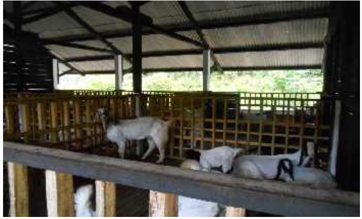
Gambar: Kandang Koloni/kelompok

1.2.1.4. Dilengkapi dengan tempat/bak/palung pakan dan tempat/bak minum yang terbuat dari bahan yang kuat, mudah dibersihkan dan disucihamakan. Tempat/bak/palung pakan merupakan tempat pakan dalam kandang, dimana harus dibuat sedemikian rupa sehingga bahan pakan hijauan yang diberikan untuk ternak kambing/ domba tidak tercecer. Pada palung juga perlu disediakan ember untuk air minum. Jumlah pakan dan minum sesuai dengan kapasitas kandang. Bak pakan dapat ditempelkan pada dinding. Ketinggian bak pakan untuk kambing dan domba berbeda. Bak pakan untuk kambing dibuat agak tinggi, kira-kira sebahunya karena kebiasaan kambing makan daun-daun perdu. Untuk domba, dasar bak pakan horizontal dengan lantai kandang karena kebiasaan domba yang merumput.