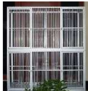
Gambar Kandang dari tembok yang disekat-sekat