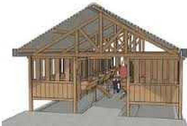
Gambar: Kandang Panggung

Kandang panggung merupakan kandang yang konstruksinya dibuat panggung atau di bawah lantai kandang terdapat kolong untuk menampung kotoran. Adanya kolong dapat menghindari kebecakan, menghindari kontak dari tanah yang mungkin tercemar penyakit, dan memungkinkan ventilasi kandang yang lebih bagus. Lantai kandang ditinggikan antara 0,5 s/d 1 meter. Dengan bahan yang sama, kandang dengan panggung yang pendek akan lebih kokoh dibandingkan dengan kandang berpanggung tinggi.