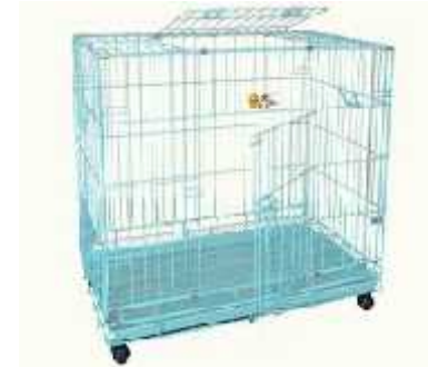
Gambar Kandang tipe cage

1.5.1.2.2.2. Kandang dari logam yang beratap.